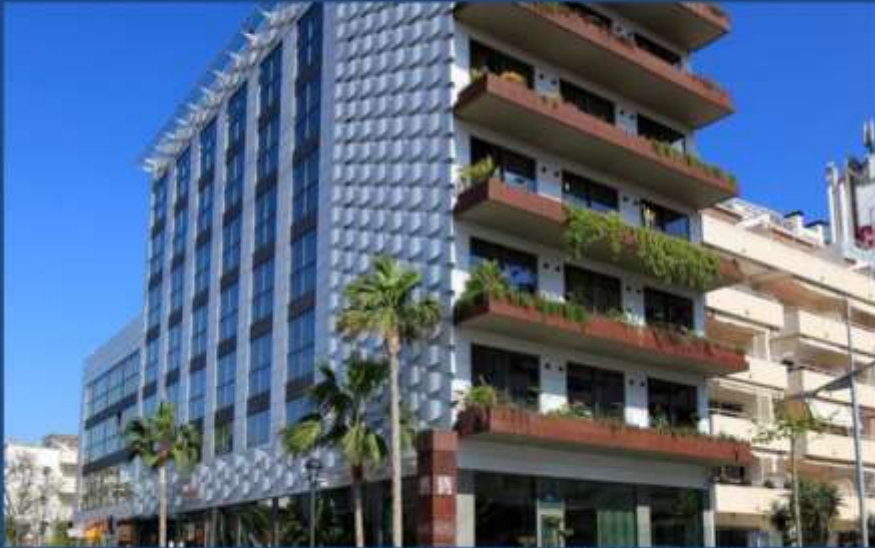
MIM Sitges Hotel Boutique & Spa, 1er Hotel certificado LEED Nueva Construcción en Europa

30 de Junio de 2017 - 10h a 14h - COAVN Delegación Bilbao (Bizkaia)