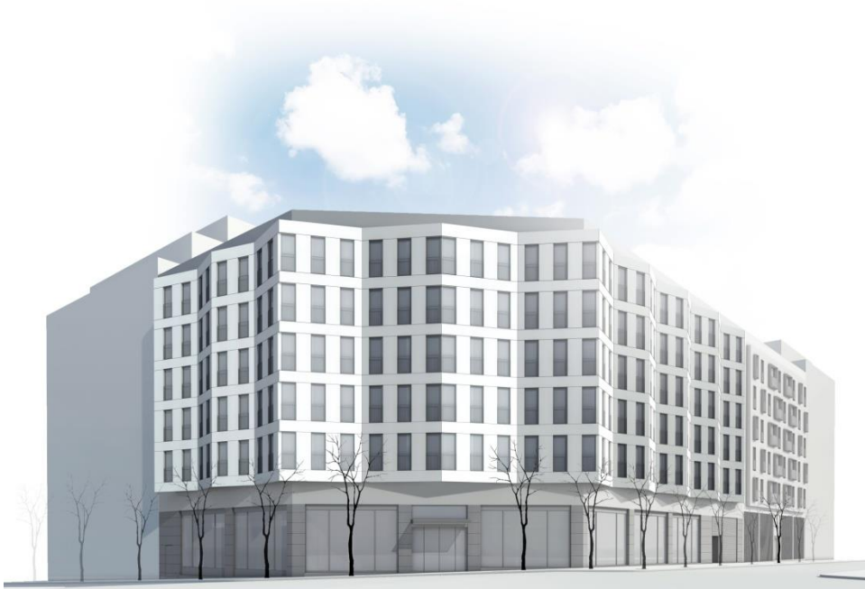
Hotel Barcelona 1882

Su arquitectura e instalaciones se han diseñado con ayuda de una consultoría externa especializada en sostenibilidad y eficiencia energética. Asimismo se está llevando a cabo la auditoria del proceso de construcción para garantizar la implementación de las estrategias.