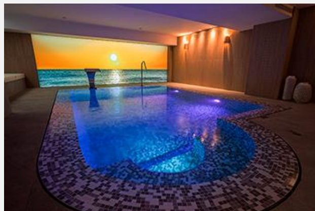
MiM MALLORCA Hotel

Los asistentes a la Jornada “ La sostenibilidad y la salud en el Sector Hotelero ”, caso MiM MALLORCA Hotel podrán conocer las novedades en el Sector y compartir experiencias en el Networking preparado, en la terraza del Hotel.