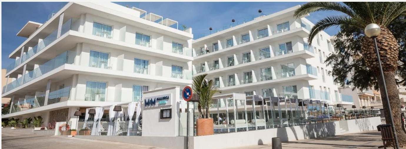
MiM MALLORCA Hotel

Caso MiM MALLORCA Hotel, primer Hotel certificado LEED V4 BD+C: HOSPITALITY en España “Diseño, Eficiencia, Salud, Construcción y Turismo Sostenible”