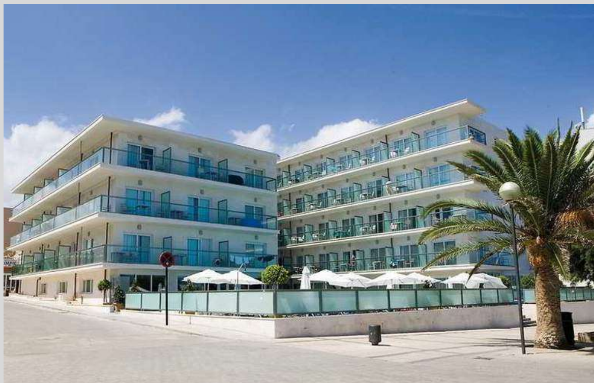
MiM MALLORCA Hotel, 1er Hotel que obtiene el certificado LEED EB en España

Certificación LEED® - Líder en Eficiencia Energética y Diseño sostenible, Sistema de Certificación de Edificios Sostenibles. Se darán a conocer las razones de negocio del rápido desarrollo de los Edificios Sostenibles en España. Donde se mostrará que la rentabilidad, el aumento de valor, el menor impacto en el Medio Ambiente, la salud y el bienestar de las personas que se obtienen, son los motores clave para el desarrollo de los Edificios LEED®. Se requiere un enfoque holístico.