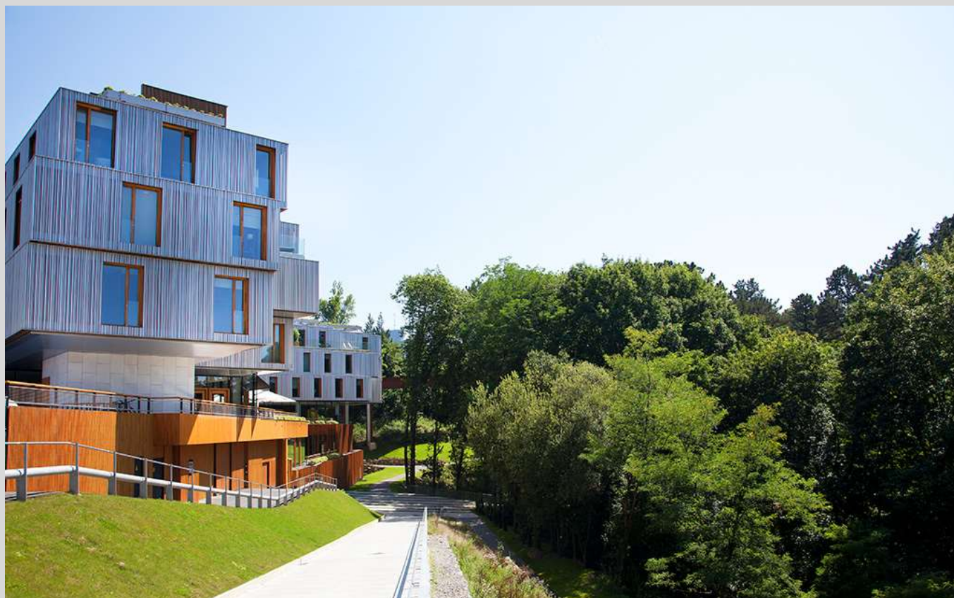
ARIMA Hotel, el primer Hotel de cuatro estrellas certificado Passivhaus

Passivhaus es un estándar de construcción de edificios energéticamente eficientes, con elevado confort interior y económicamente asequibles.