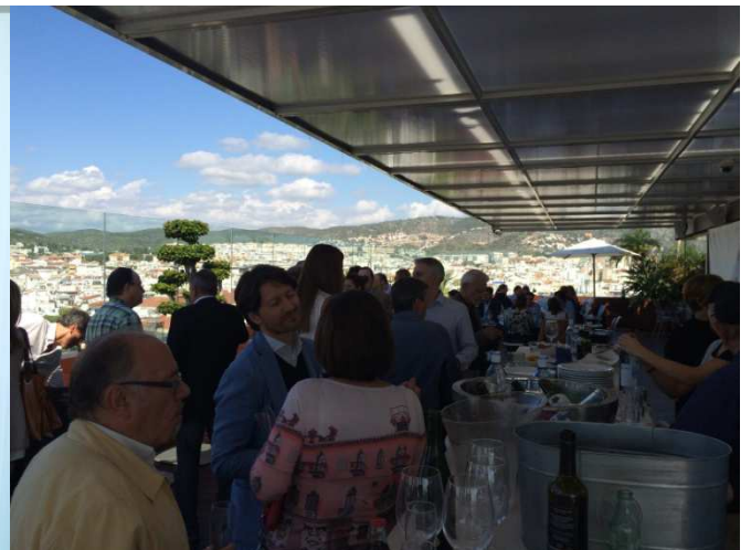
Networking en el Sky Bar en IV BioLEED

¿Interesado en participar en la V Conferencia BioEconomic® Certificación LEED®?