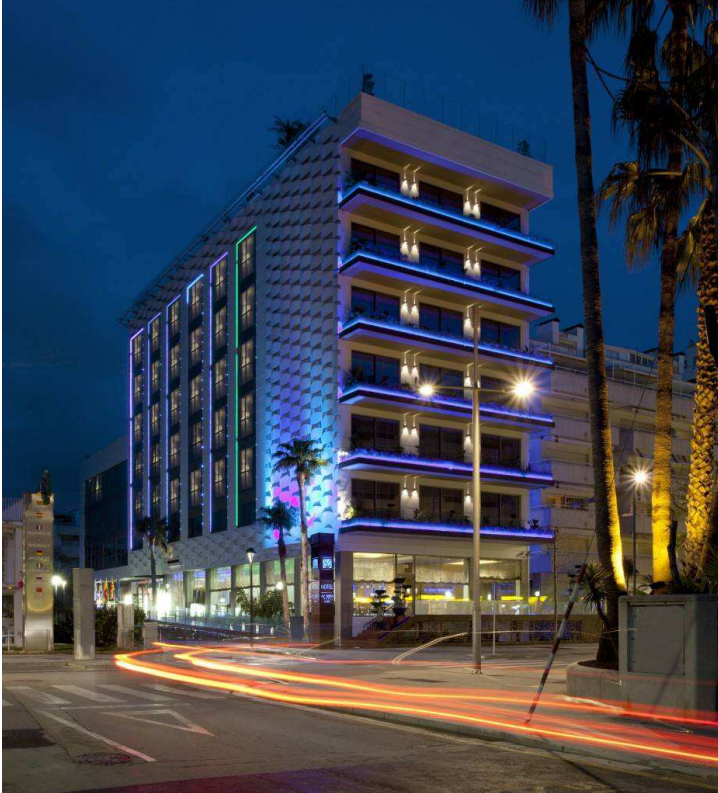
Hotel MiM Sitges

Ya se conoce la fecha y el lugar de celebración de la próxima edición de la V Conferencia BioEconomic® Certificación LEED®, la certificación se centrará en Hoteles y Edificios. Tendrá lugar en el Hotel MiM Sitges Boutique & Spa, el 16 de Febrero de 2018, con la previsión de duplicar el número de asistentes.