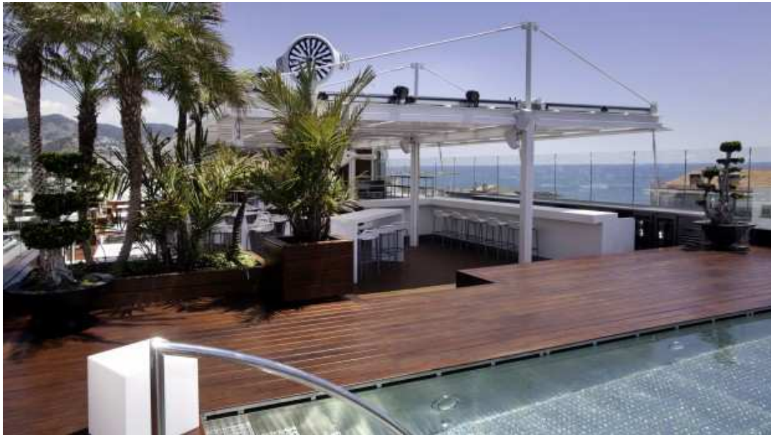
Sky Bar - Hotel MiM Sitges

Las cifras de la última edición de la IV Conferencia BioEconomic® Certificación LEED® reflejan su éxito como evento de referencia en el Diseño y Construcción Sostenible con la Certificación LEED® en Hoteles y Edificios, con cerca de 100 profesionales registrados .